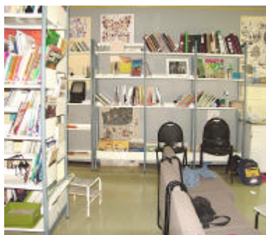
Parmi les activités extra-scolaires, la BCD

Hormis l'école, les activités l'enceinte de l'établissement ou à éducation physique et sportive, équitation, judo, canoë, tennis, peinture, dessin, bibliothèque, montage radio, informatique, sorties, participations à des